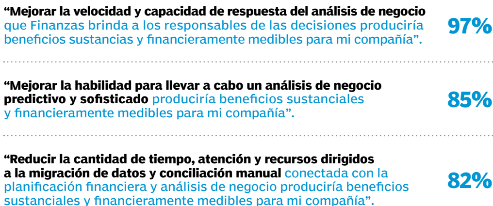
FIGURA 2 Porcentaje de encuestados que acuerdan con cada afirmación.

El análisis de los resultados de la encuesta mundial muestra una relación entre la integración estrecha de los sistemas de planificación financiera con los sistemas core de ERP y la habilidad de Finanzas para brindar soporte a la toma de decisiones efectiva. El ochenta y dos por ciento de los encuestados que reportan que sus sistemas de planificación financiera están “muy estrechamente integrados con los sistemas core de ERP, y requieren una migración de datos mínima” confirman que sus sistemas de planificación financiera “contribuyen sustancialmente con la habilidad de Finanzas para dar soporte a la toma de decisiones”. En contraste, entre los encuestados que reportan que sus