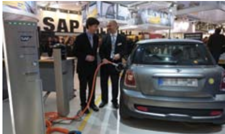
CeBIT 2010, Hannover

Im Mittelpunkt von MeRegio steht die Entwicklung einer „Minimum Emission“-Zertifizierung, die in der Modellregion Karlsruhe/Stuttgart angewandt werden soll. Neben der SAP AG sind die EnBW Energie Baden-Württemberg AG, ABB AG, IBM Deutschland GmbH, Systemplan GmbH und die Universität Karlsruhe (TH) beteiligt. SAP Research hat dabei die Aufgabe, eine „E-Energy Market Platform“ für das Internet zu entwickeln, auf der ein