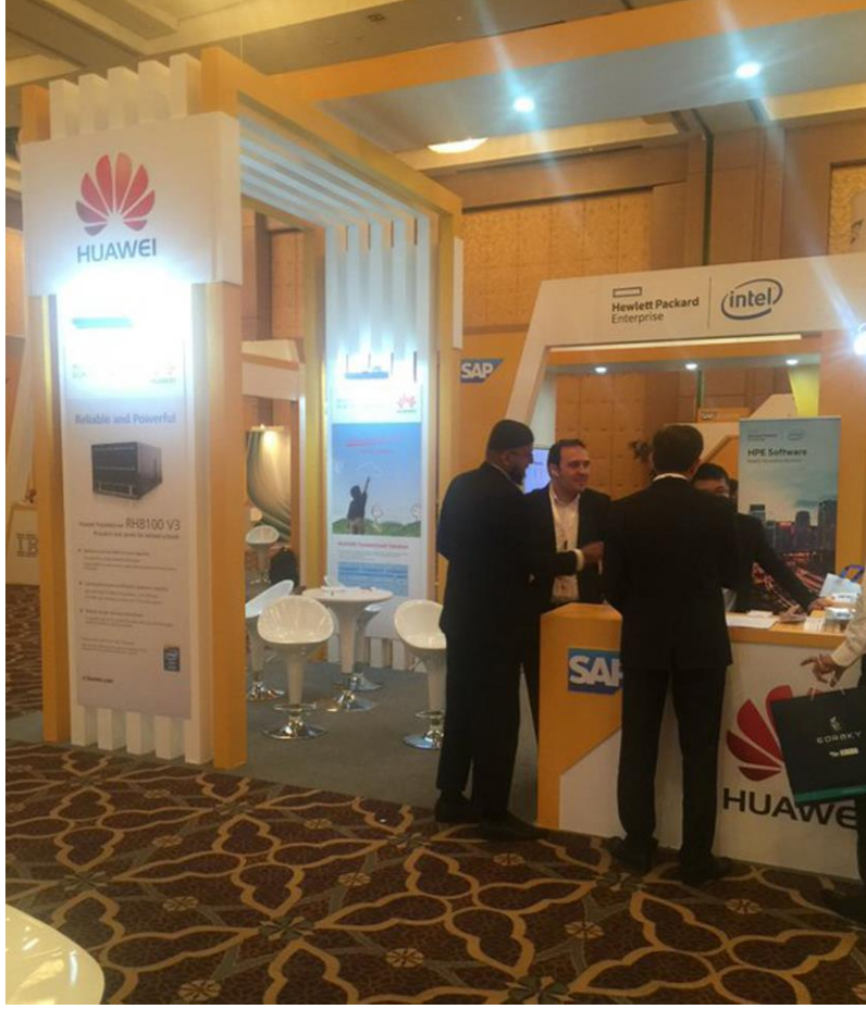
هواوي المملكة العربية السعودية كانت إحدى الجهات المشاركة في منتدى إس إيه بي