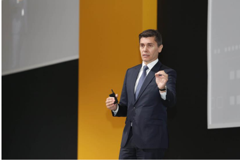
ستيف تريكامس، النائب الأول للرئيس والمدير العام لشركة "إس إيه بي" جنوب أوروبا والشرق الأوسط وإفريقيا يتحدث عن القيمة التي يحققها الاقتصاد الرقمي