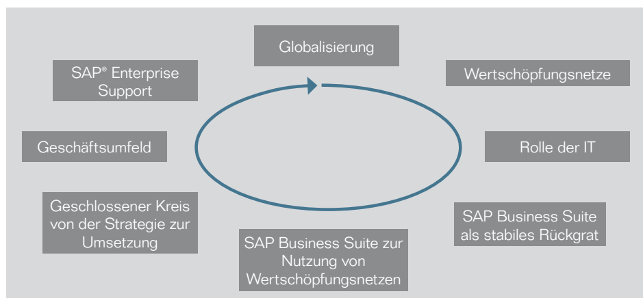
Abbildung 1: Unternehmen in der globalisierten Welt

SAP Enterprise Support ist ein ganzheitliches Supportangebot, das Ihre Prozesse durchgängig unterstützt, somit Ihre Investitionen in SAP-Software schützt und Ihnen alle Wachstumsmöglichkeiten eröffnet, die die globale Wirtschaft zu bieten hat.