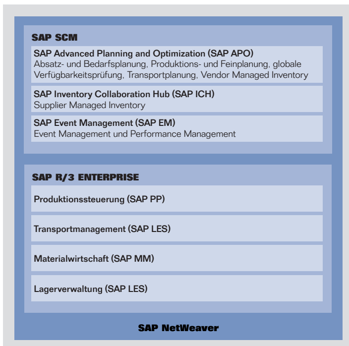
Abb.1: mySAP Supply Chain Management