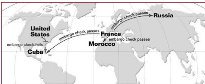
Abbildung 2: Beispiel einer Lizenzprüfung

Kostenloser Online Newsletter www.sap.de/sapimfokus