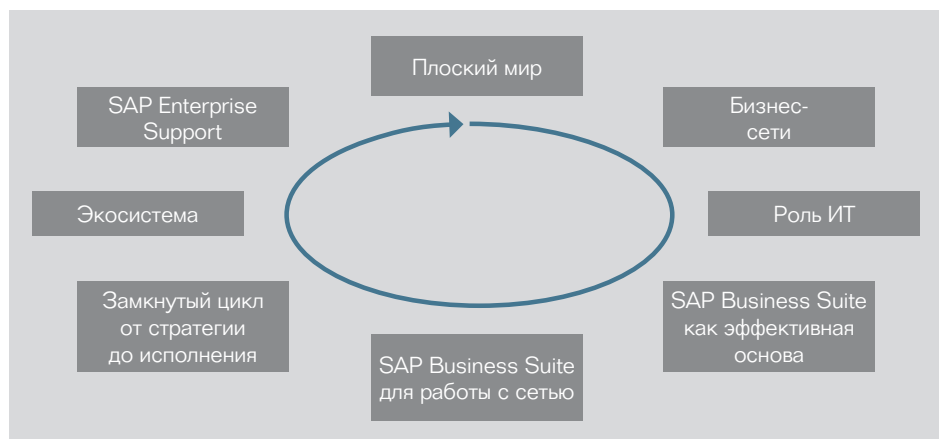
Рис. 1. Бизнес в современном «плоском» мире

SAP Enterprise Support — это целостное, комплексное предложение, которое поможет Вам защитить свои инвестиции в решения SAP, используя при этом возможности роста бизнеса, открывающиеся в современном «плоском» мире.