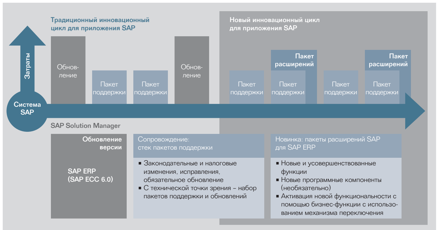
Рис. 3. Изменение инновационного цикла приложения

Независимо от своего размера бизнеса, работая с критически важными приложениями, требующими интеграции, клиенты обращаются к сервис-ориентированной архитектуре (SOA), чтобы получить конкурентное преимущество. Чтобы реализовать такое инновационное решение, нужна стабильно работающая платформа, а для этого требуется новейший уровень поддержки. Инновации на программной платформе SAP внедряются через пакеты расширений SAP, а также путем интеграции сторонних приложений и собственных разработок.