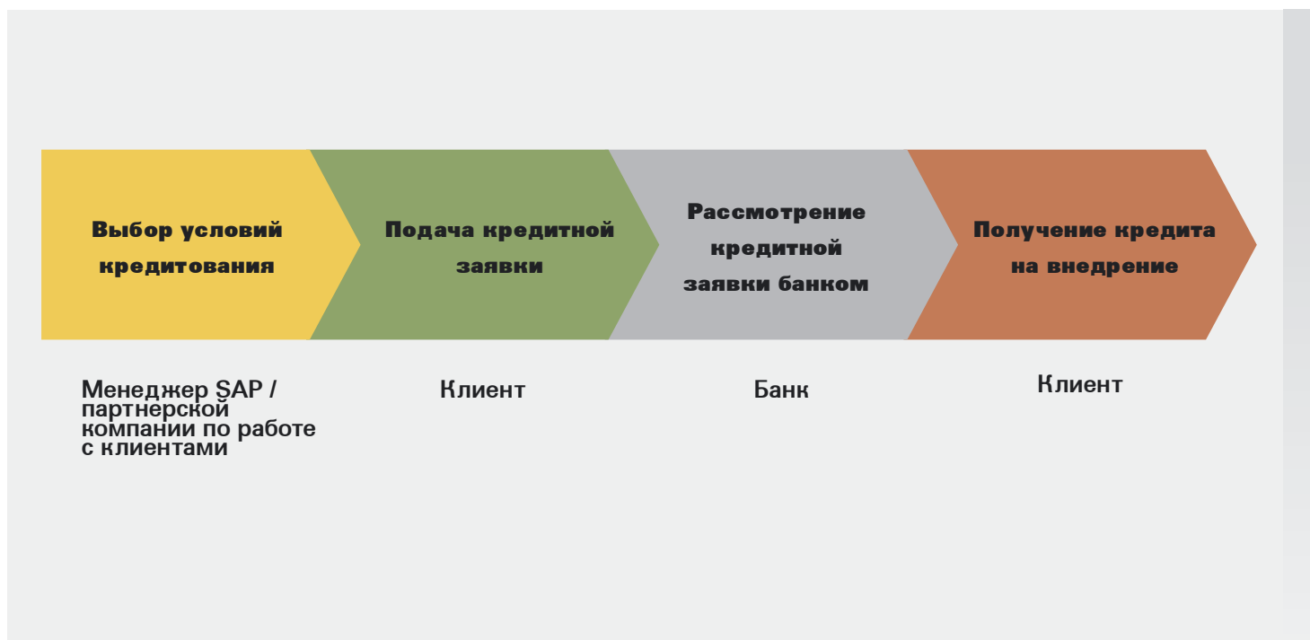
Рисунок 1. Процесс финансирования проекта по программе SAP Financing.