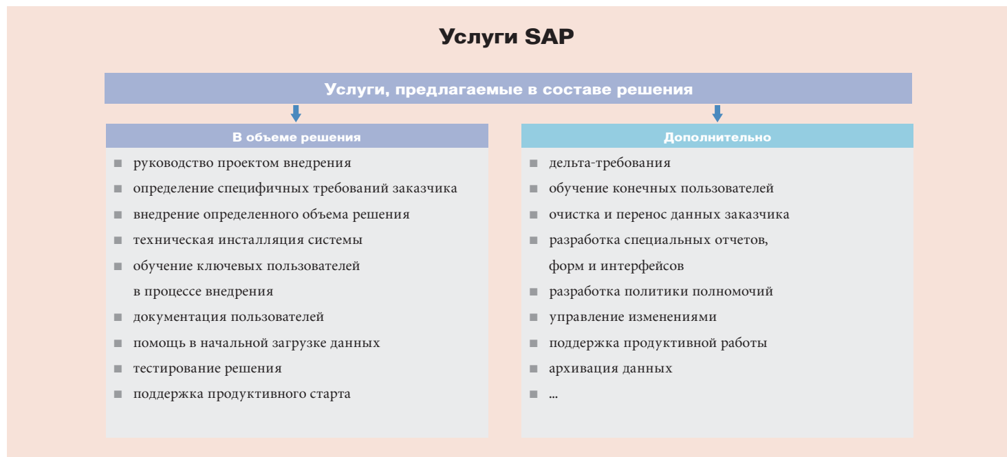
Рисунок 3. Услуги по внедрению пакетов решений SAP All-in-One ERP.

Более чем 30 лет опыта работы во всех отраслях и более 17000 клиентов во всем мире, представляющих средний бизнес, являются доказательством того, что SAP – оптимальный выбор для организаций, которым требуется экономически эффективное и гибкое ERP-решение для внедрения инноваций и ускорения темпов развития. Наши системы нацелены как на решение базовых задач, стоящих перед предприятием среднего масштаба, так и на реализацию специфичных требований, которые отражают уникальность каждой компании.