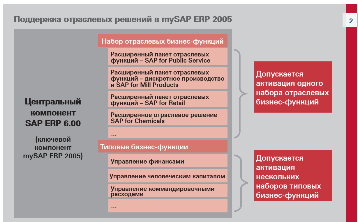
Рисунок 2. Предлагаемые надстройки – дополнительные отраслевые функции и типовые бизнес-функции.

Кроме того, внедрение таких предварительно скомпонованных версий, разработанных с учетом специфических особенностей различных отраслей, обеспечивает Вам возможность сократить общую стоимость владения путем консолидации систем и, соответственно, упростить процесс управления системой приложений предприятия.