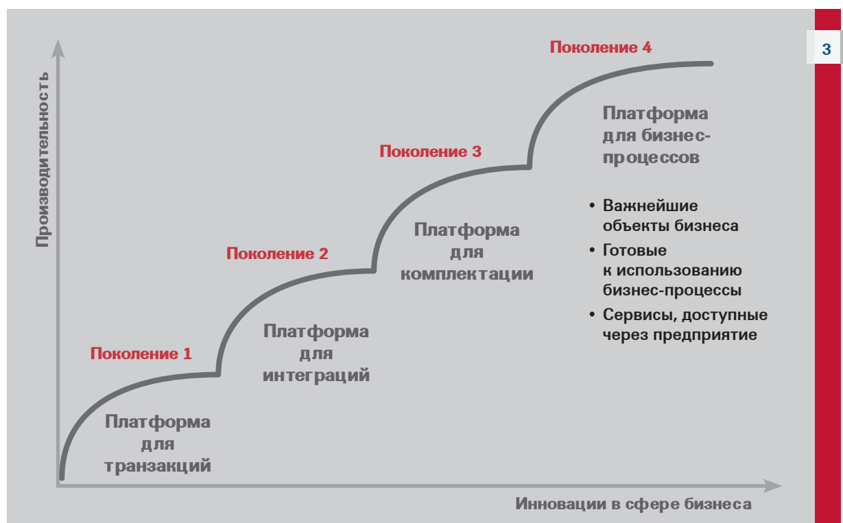
Рисунок 3. Этапы развития платформы бизнес-процессов.

Как пояснялось выше, mySAP ERP обеспечивает более высокий уровень гибкости бизнес-процессов, позволяющий ускорить внедрение инноваций с сервисной поддержкой и использованием платформы SAP NetWeaver. И, разумеется, клиенты, перешедшие на использование приложений mySAP ERP 2004 или 2005, получают возможность более эффективного перехода к следующей версии SAP NetWeaver.