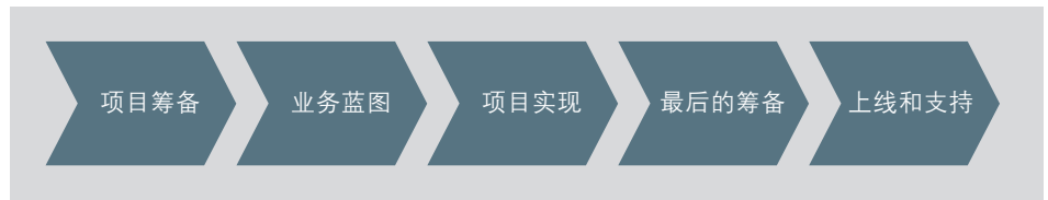
图 2：快速实施方法的 5 个阶段