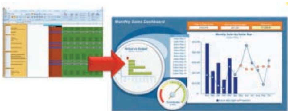
图表1：广泛的呈现选项

采用Xcelsius® Present软件取代无穷的数据排列以及静态统计表格，为人们呈现眩目的交互式可视化内容。