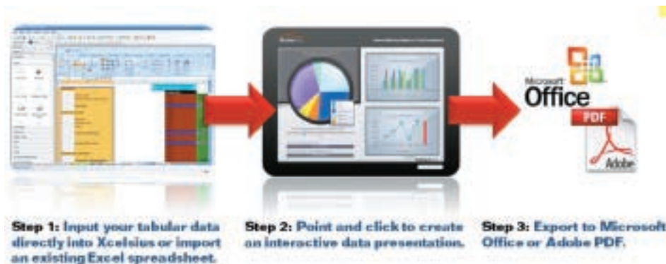
图表4: Xcelsius® Present的工作流

采用Xcelsius Present软件，通过动态形象的可视化和交互式呈现文件，去吸引、通告和说服您的受众。