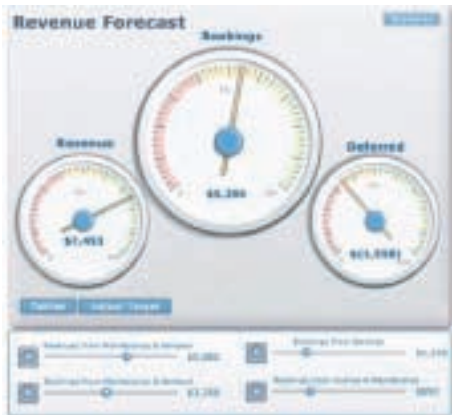
图表2：营收预测上的可视化模型

我们最终取得的结果就是那些更加快捷、高度客观和智能的业务决策，这些有助于您捕捉到诱人的市场先机，并在激烈的市场竞争中获胜。