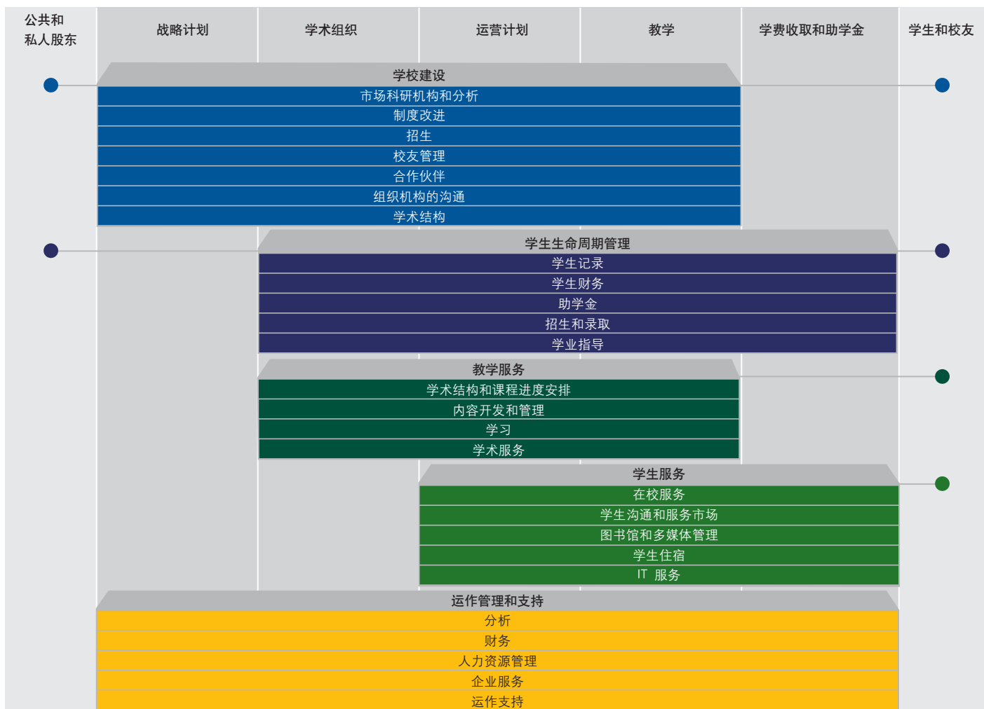
图 1：对应到 SAP 高等教育和科研机构解决方案的关键业务流程

“Ole Miss 大学与 SAP 联手，是因为 SAP 提供丰富的功能并致力于不断改进产品以满足客户需求。”