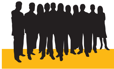
Capacitación del Usuario Final