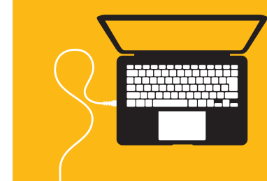
Juegos de Simulador ERP