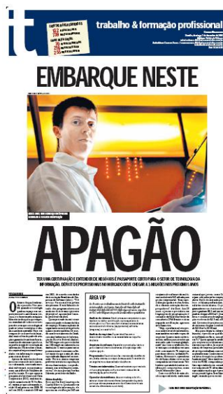
Correio Brasiliense – 7 de Dezembro

Uma luz para o “apagão” é encontrar profissionais que entendam do negócio e tenham uma certificação reconhecida pelo mercado.