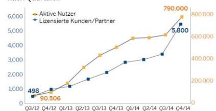
SAP HANA Performance im Markt nach Quartalen