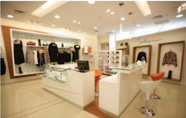
Vista de una de las sucursales de la tienda Sekani, ejemplo de constancia y buenos resultados.